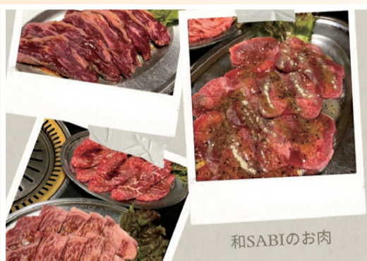
◀ お肉本来の味わいを♪