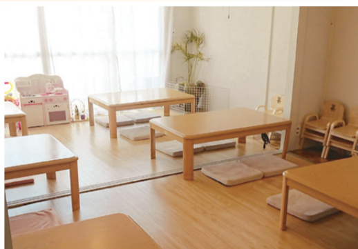
◀ 2階のキッズフロア(お座敷)

1階は大人の方がゆっくり癒やされる空間、2階は赤ちゃんが泣いても周りのお客様に気を使わずにおくつろぎいただけるお子様連れのお客様専用の空間。大人のお客様もお子様連れのお客様もどちらもお楽しみいただけるようフロアを分け、スタッフ一同、笑顔でお迎えし、癒やしを届けております。